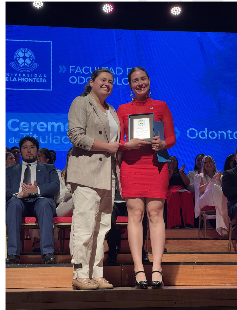
U. De la Frontera